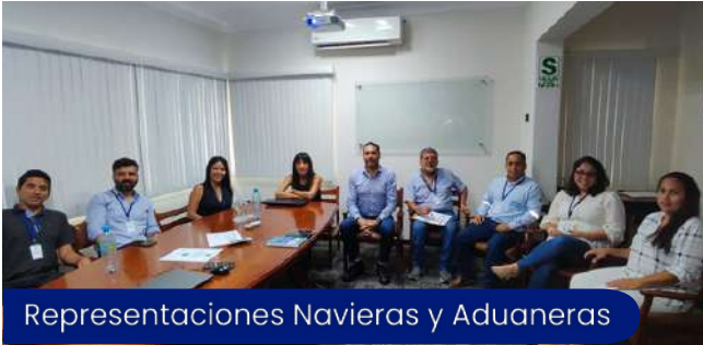
Representaciones Navieras y Aduaneras