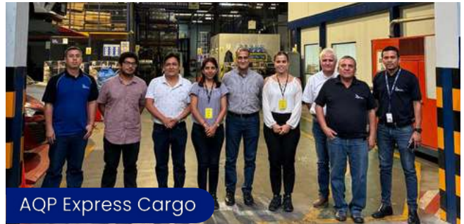
AQP Express Cargo