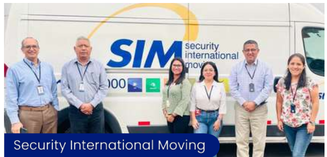
Security International Moving