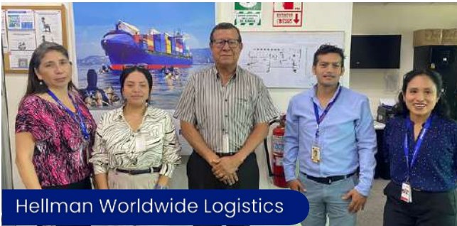
Hellman Worldwide Logistics