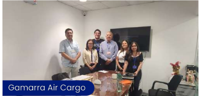
Gamarra Air Cargo